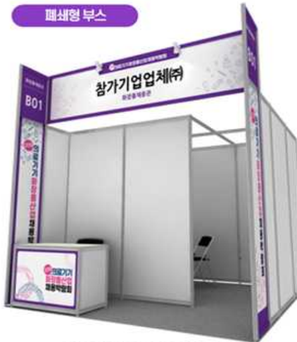
심화면접이 가능한 폐쇄형 부스 제공