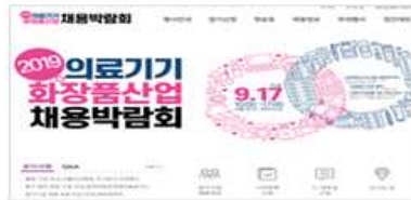
채용박람회 홈페이지 내 심화면접 사전접수 가능 제공