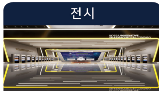
창원미래비전(Vision, 備展) '미래를 준비하다'

개폐막식 오프라인 온라인 기조연설 및 VIP 스피치 녹화 또는 실시간 중계 산업시찰 오프라인 온라인 기업현장방문