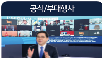
한·세계화상 비즈니스 협력 공식 세레모니

개폐막식 오프라인 온라인 기조연설 및 VIP 스피치 녹화 또는 실시간 중계 산업시찰 오프라인 온라인 기업현장방문