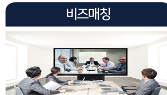
한· 화상 기업간 실질적인 비즈니스 매칭

3D온라인 전시관 온라인 Digitech 전시관 조성 신기술전시쇼(오아시스) 온라인 클로세움 전시관 조성 기업별 제품 홍보쇼 진행