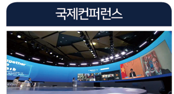
한· 화상기업 공동번영의 포스트 신남방 정책

개별 비즈매칭 상담 오프라인 온라인 바이어와 1:1 온라인상담 방문 화상대상 비즈매칭