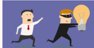
아이디어 탈취 행위