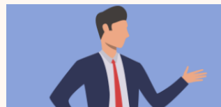
대리인 또는 대표자의 무단 상표사용 행위