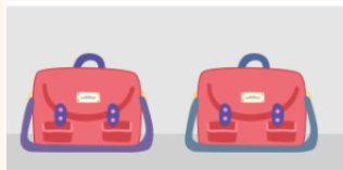
상품형태 모방 행위