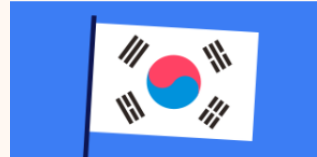
자유무역협정에 따라 보호하는 지리적 표시의 사용행위