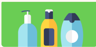
원산지 생산지 또는 제품의 질양 등의 오인유발행위