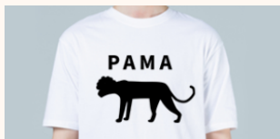
널리 알려진 상표의 식별력을 손상하는 행위