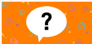
상품주체 및 영업주체 (영업외관) 혼동 초래 행위