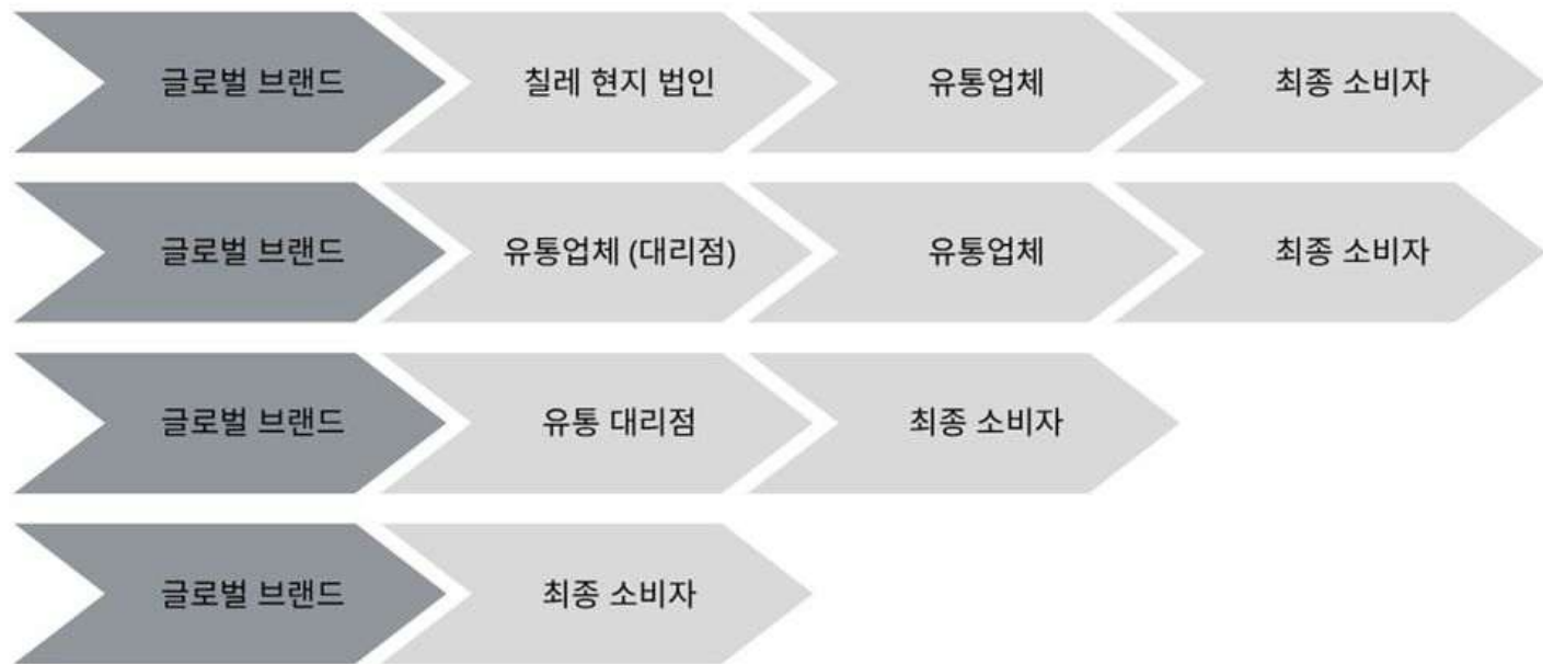
[자료: KOTRA 산티아고 무역관, 2026]