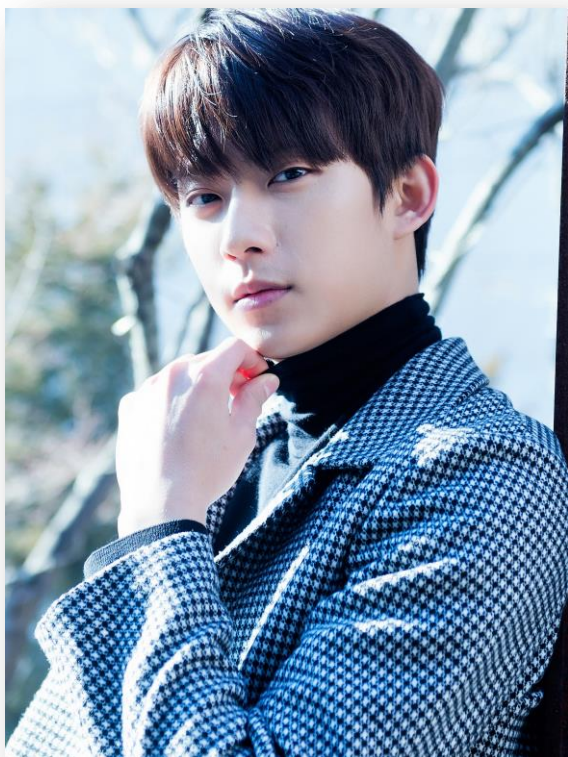
B1A4 공찬 / 1993년생

데뷔 7년차 아이돌 / SNS 팔로워 : 38만명 육박 B1A4 공식 실물왕자, 비주얼 멤버