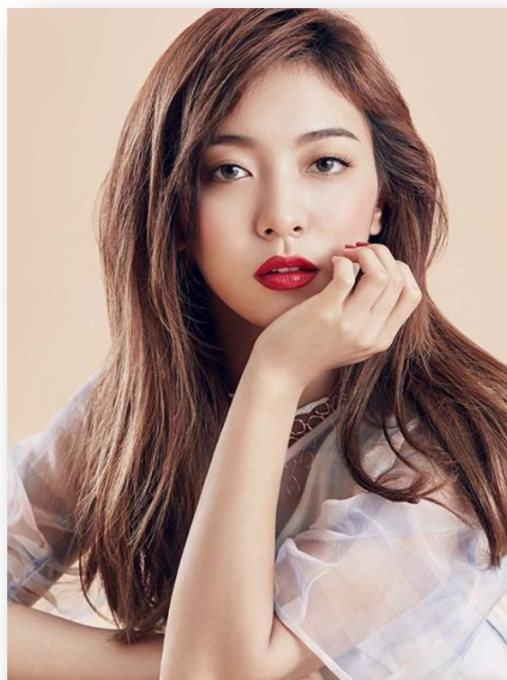
FX 루나 / 1993년생

데뷔 10년차 아이돌 / SNS 팔로워: 220만명 육박 아이돌 실물 여신 1위로 뽑힌 대륙의 여신