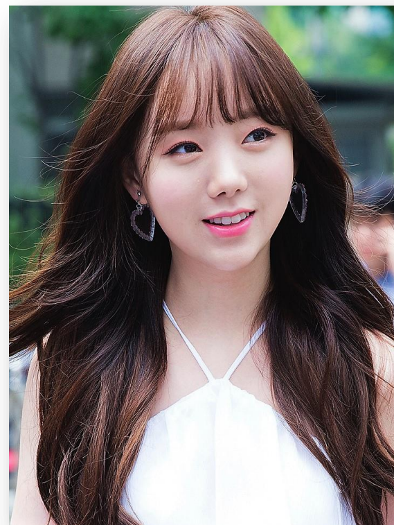
러블리즈 케이 / 1995년생

데뷔 9년차 아이돌 / SNS 팔로워: 150만명 육박 국내외 팬들을 거느린 FX의 메인보컬