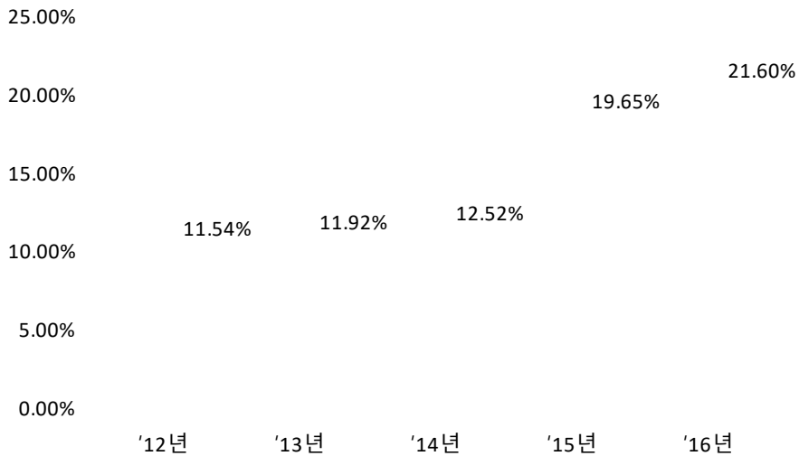
그림 2) 최근 4년간 유형별 생산실적