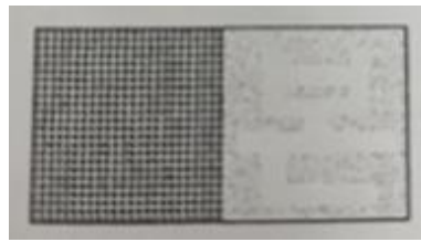
[복사본 증명서 복사방지마크]