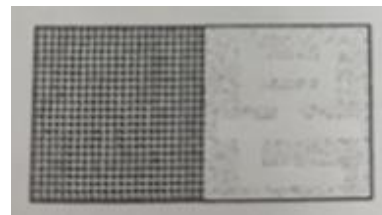
[복사본 증명서 복사방지마크]