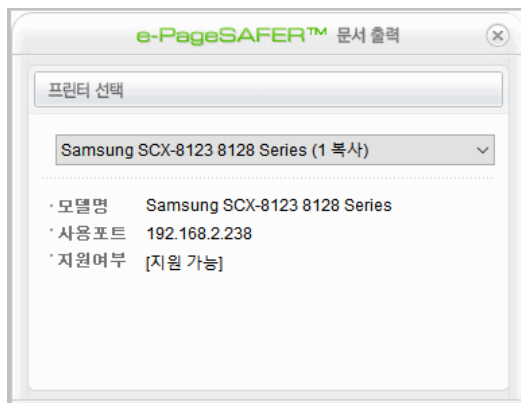
[지원 가능 프린터]