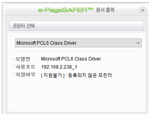
[등록되지 않은 프린터]