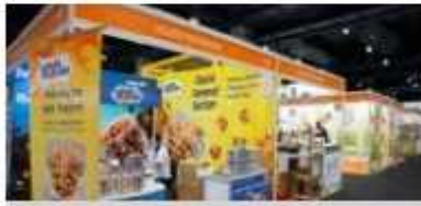
Hybrid (Physical & Virtual) Booth

*Applicable for MALAYSIAN companies ONLY