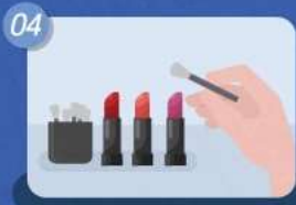
04 테스트는 손이 아닌 꼭! 도구 활용하기