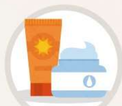
충분한 보습, 자외선차단제