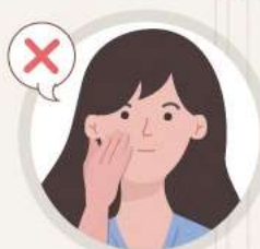
얼굴 만지지 않기