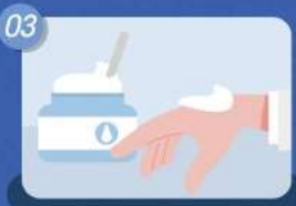
03 테스트는 입술, 눈이 아닌 손목, 손등에 하기