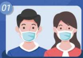
01 매장 방문 시 반드시 마스크 착용하기