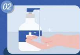
02 테스트 제품 이용 전/후 손 소독제 사용하기