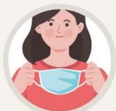
마스크 안 피부 환기