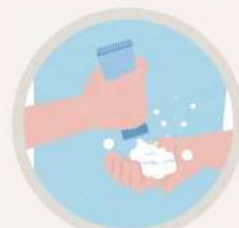
자극 없이 꼼꼼한 클렌징