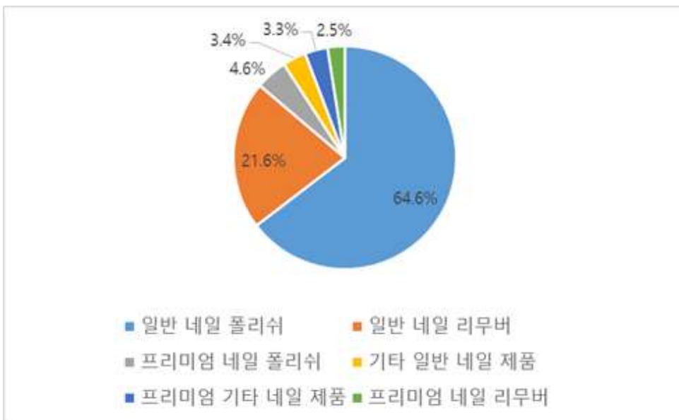
분류별 네일 제품류 점유율(2020년) (단위: %)

2020년 기준 태국 네일 제품 시장은 일반 제품군이 약 90%의 시장을, 프리미엄 제품군이 약 10%의 시장을 점유하고 있다. 일반 매니큐어와 페디큐어 등 네일 폴리쉬 제품이 전체 네일 제품 시장의 64.6%를 차지하였으며, 일반 네일 리무버가 21.6%로 두 번째로 높은 비중을 차지했다.