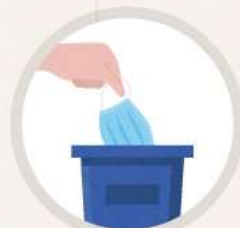
오염된 마스크 재사용하지 않기