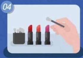
04 테스트는 손이 아닌 꼭! 도구 활용하기