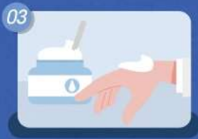
03 테스트는 입술, 눈이 아닌 손목, 손등에 하기