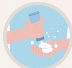
자극 없이 꼼꼼한 클렌징