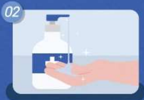
02 테스트 제품 이용 전/후 손 소독제 사용하기