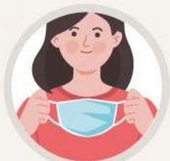
마스크 안 피부 환기