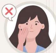
얼굴 만지지 않기