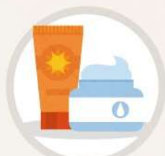
충분한 보습, 자외선차단제