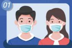
01 매장 방문 시 반드시 마스크 착용하기