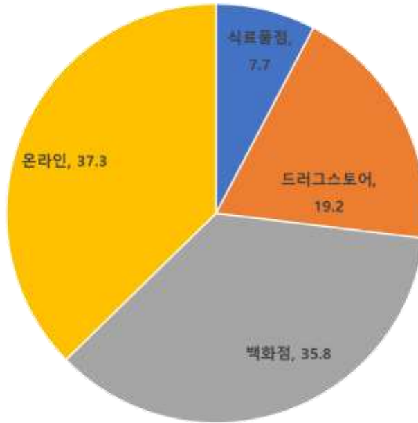
2020년 기초화장품 유통구조

2020년 기준, 기초화장품의 오프라인 매장 유통 비중은 62.7%에 달했으며 온라인 유통(Shopee, PC Home, momo, etmall 등)은 37.3% 수준이다.