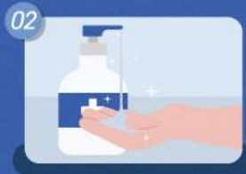
02 테스트 제품 이용 전/후 손 소독제 사용하기