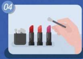
04 테스트는 손이 아닌 꼭! 도구 활용하기