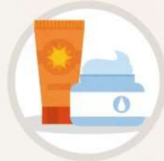
충분한 보습, 자외선차단제