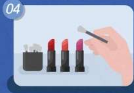
테스트는 손이 아닌 꼭! 도구 활용하기