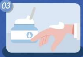
테스트는 입술, 눈이 아닌 손목, 손등에 하기