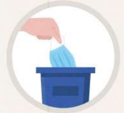
오염된 마스크 재사용하지 않기