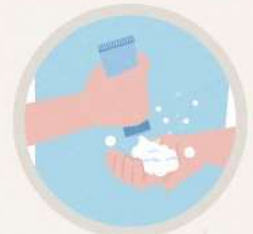
자극 없이 꼼꼼한 클렌징