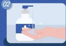
테스트 제품 이용 전/후 손 소독제 사용하기