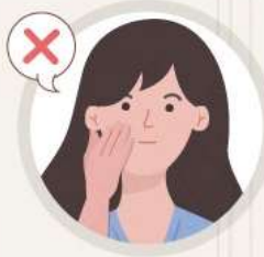
얼굴 만지지 않기