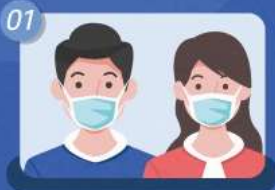
매장 방문 시 반드시 마스크 착용하기