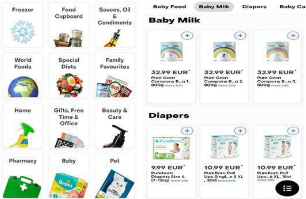
〈총알배송 플랫폼 내 영유아 용품 판매 모습〉

팬데믹 이후 확대된 전자상거래 선호 현상은 온라인 쇼핑에 익숙한 젊은 부모들의 영유아 제품 구매에도 큰 영향을 미치고 있다. 저가 상품 검색이 쉽고 부피가 크고 무거운 기저귀 같은 제품이 온라인 판매 인기 상품이다. 앞으로도 온라인 구매 인기 상품의 범위는 계속 확대되고 있는데, 특히 최근 급성장하고 있는 총알배송 서비스를 통한 판매도 늘고 있다. 이러한 서비스는 아직은 주로 자녀가 없는 젊은 성인에게 초점을 맞추고 있지만, 시간에 쫓기는 부모에게 더 빠른 해결책이 되고 있다.