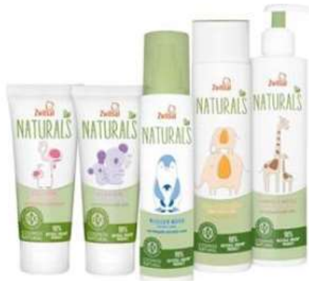
[자료: advion.nl, bol.com]