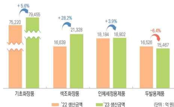
<국내 화장품 유형별 생산액>